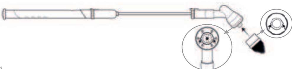
Abbildung 1 | Illustration 1 | Figura 1 | Figure 1 | Afbeelding 1 | Ábra 1 | Obrázek 1 | Obrázok 1 | Imaginea 1 | Rysunek 1 | Şekil 1